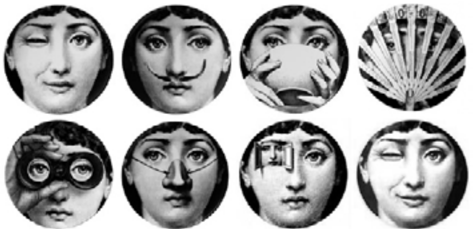
Tema e variazioni di P. Fornasetti / video Tema e variazioni + articolo Anatomia di una musa sul Corriere