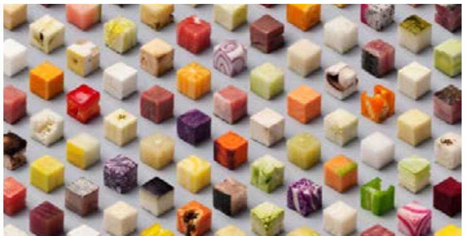
Cubes di Lemert & Sander