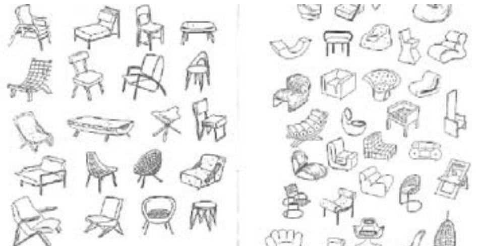
Le sedie di Munari di Bruno Munari