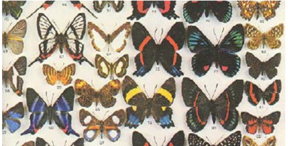
Variazioni in natura