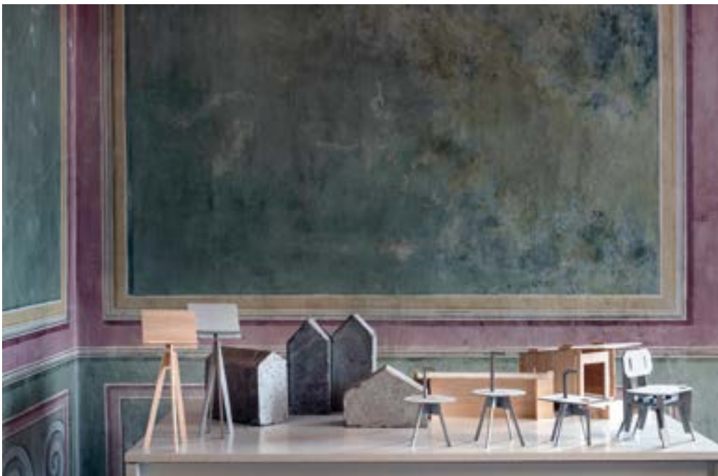
Collezione aperta—laboratorio di Design A. A. 2013–14 con Vittorio Venezia, Master Out [of the] Door