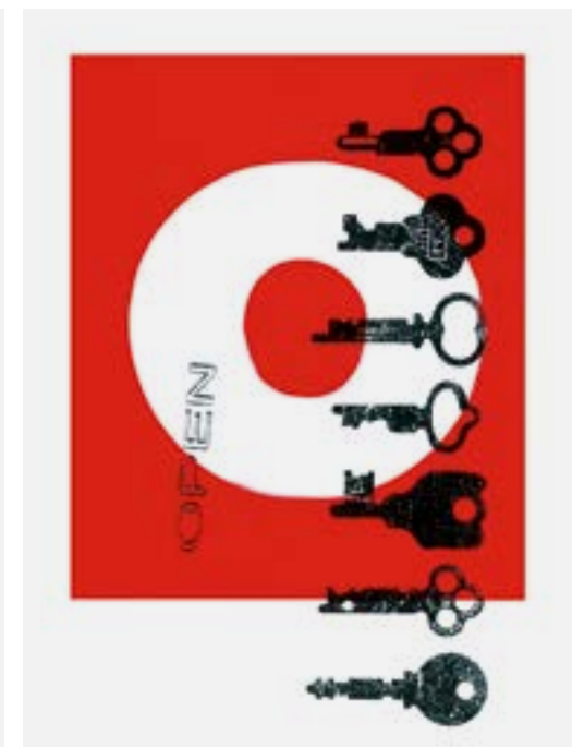
Letter works—Workshop di Graphic Design con Claude Marzotto di Obelo