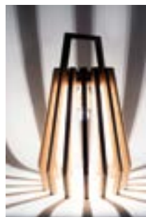
Collezione aperta C103 —lampada progetto di Margherita Pappalardo