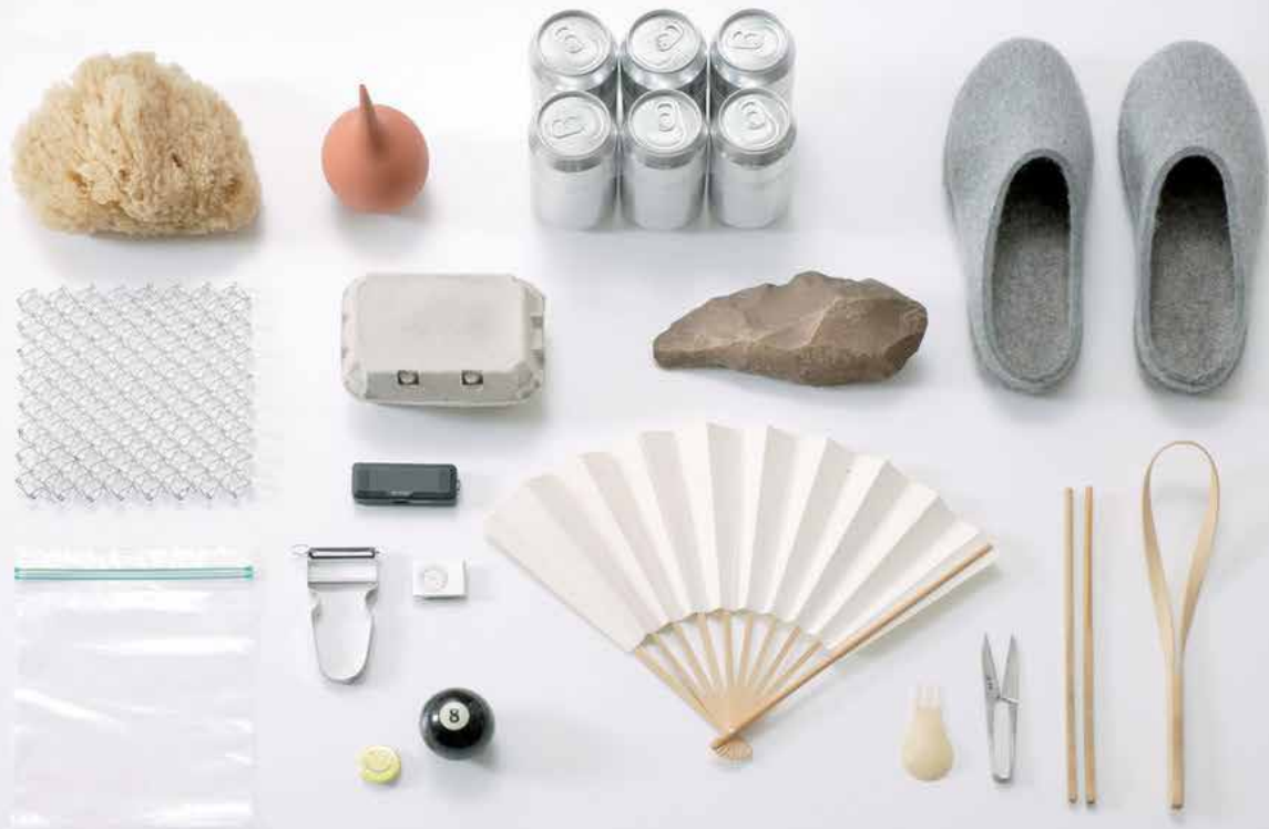
Jasper Morrison: Super Normal