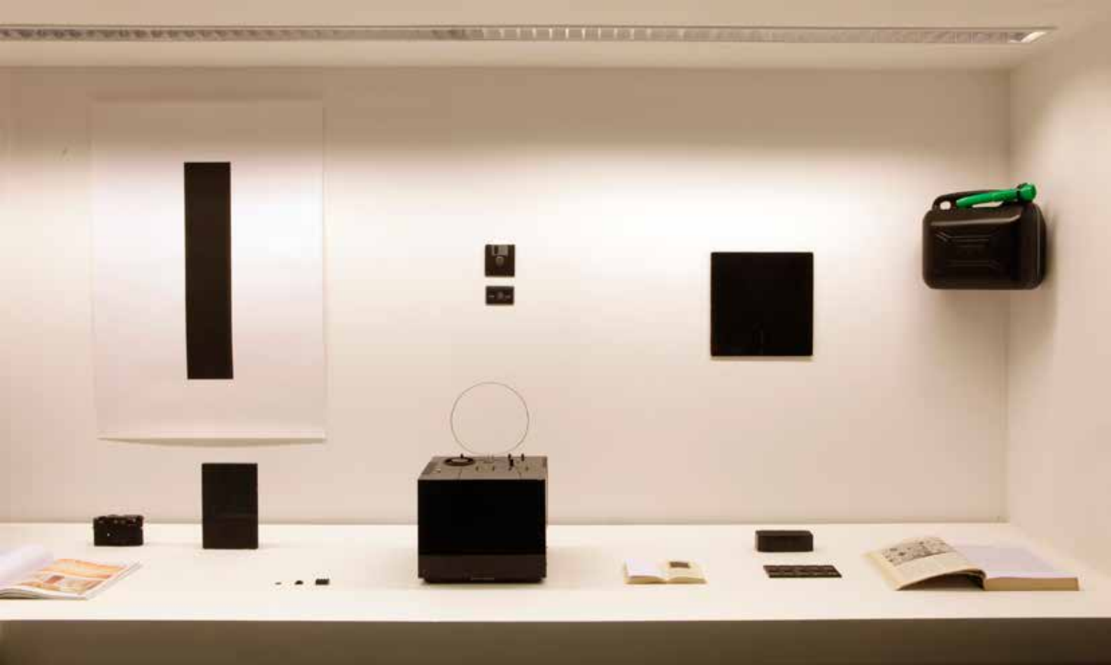
Konstantin Grcic: Black and Squared