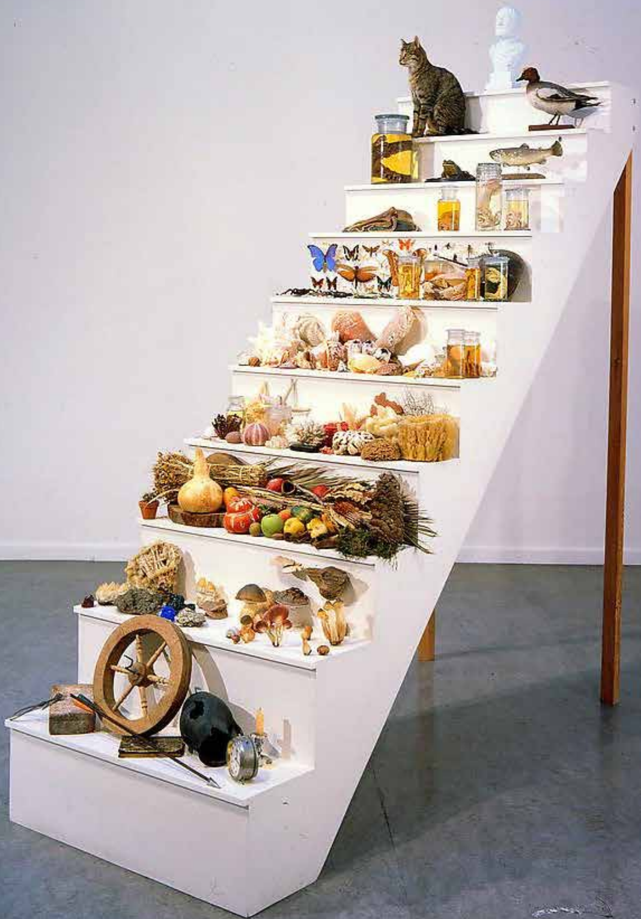
Mark Dion: Scala Naturae